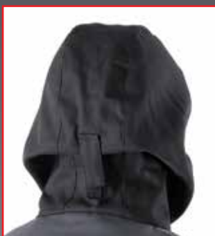
Sistema de regulación en el dorso de la capucha.

Largo de 121 cm para garantizar una protección óptima hasta las rodillas del operador.