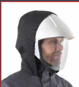
Capucha con casco.

Una capucha ajustable para mejor protección de cabeza y cuello en casos de alto riesgo, a llevar con una pantalla o casco.