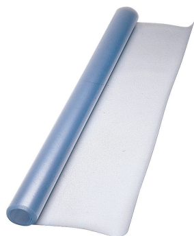
MP-35 / MP-40