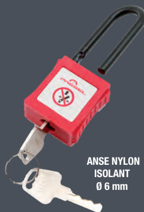
ANSE NYLON ISOLANT Ø 6 mm