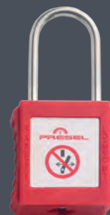
ANSE MÉTAL Ø 4 mm