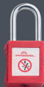
ANSE MÉTAL Ø 6 mm

Dimensions corps : 38 x 45 x 20 mm. / Hauteur anse : 38 mm. Poids : 60 g (sans clé). / Livré avec 2 clés à empreinte de type serpent. Numéro des clés gravé sur chaque clé.